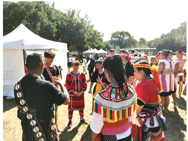
表演前的祈福儀式