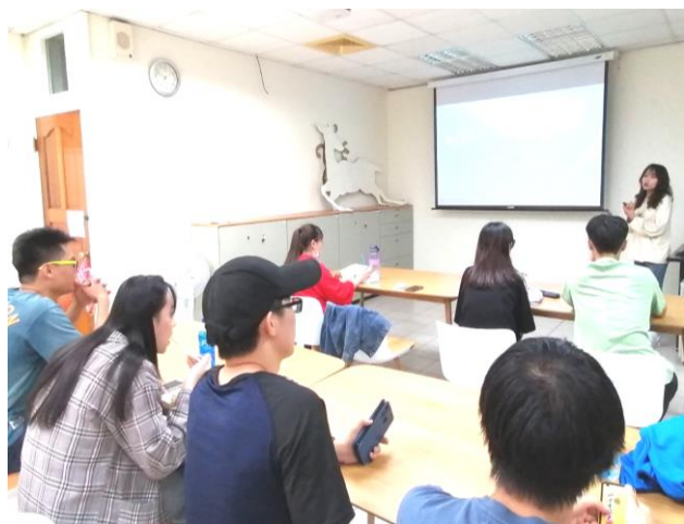
華文系瓦翊同學分享 到澳洲打工換宿的經驗