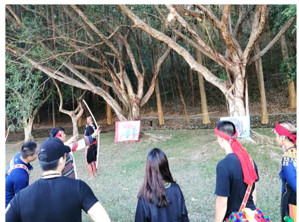
進行傳統射箭競賽