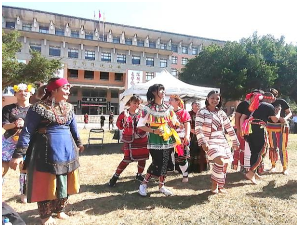
透過歌舞展演相互交流